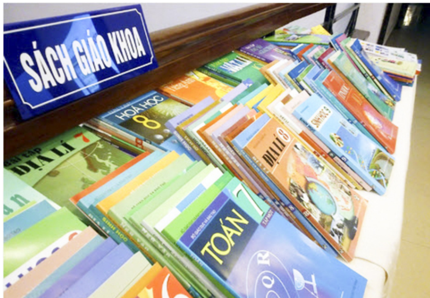
Nguồn thu bí ẩn đang bù lỗ cho SGK những năm qua.

Chia sẻ về việc bù lỗ cho SGK những năm qua, ông Nguyễn Văn Tùng, Phó Tổng biên tập NXB Giáo dục cho biết năm 2015 lỗ 53,7 tỷ đồng, năm 2016 lỗ 43,3 tỷ đồng, năm 2017 lỗ 37 tỷ đồng, năm 2018 lỗ 50 tỷ đồng.