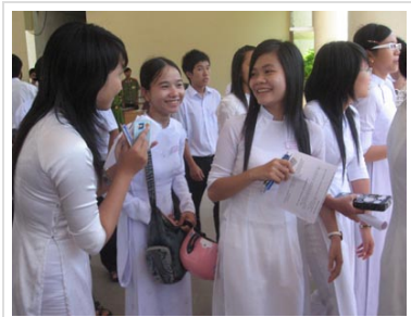
Ảnh minh họa (ĐNĐT)

(Chinhphu.vn) - Theo thống kê sơ bộ từ Bộ Giáo dục và Đào tạo, tỷ lệ học sinh đỗ tốt nghiệp THPT năm 2010 đạt 92,57%, cao hơn đáng kể so với mức 83,8% của năm 2009.