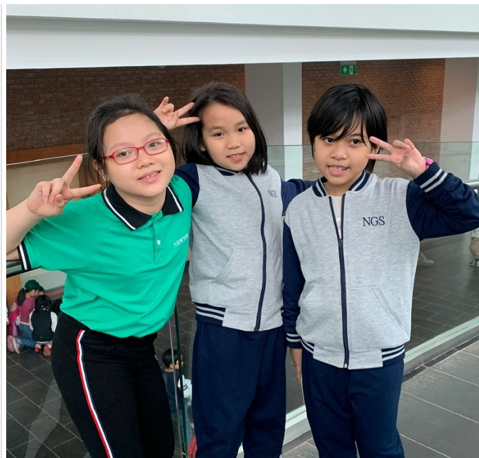
Học sinh ôn thi song bằng hụt hẫng vì thông tin Hà Nội dừng tuyển sinh hệ song bằng năm học 2021 - 2022

Về vấn đề trên, lãnh đạo một trường THCS ở Hà Nội cho biết: Ngày 20/4, tại buổi làm việc giữa với Sở GD&ĐT Hà Nội với Hiệu trưởng các trường THCS, THPT đang thí điểm mô hình đào tạo song bằng, việc dừng tuyển sinh lớp 6 hệ song bằng năm học 2021 - 2022 là một trong các nội dung được trao đổi. Tuy nhiên, hiện Sở GD&ĐT Hà Nội chưa có văn bản chính thức hướng dẫn về việc trên nên các trường vẫn đang chờ chỉ đạo của Sở rồi mới triển khai, thông báo.